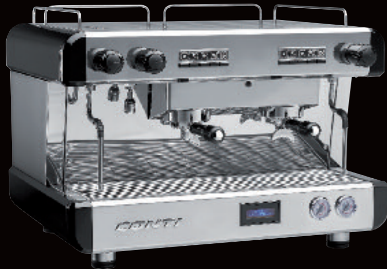
CC100 Espresso Display