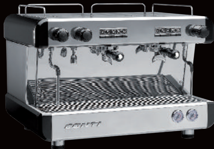
CC100 Tall Cup