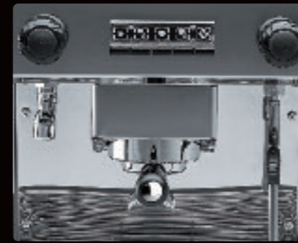
1 et 2