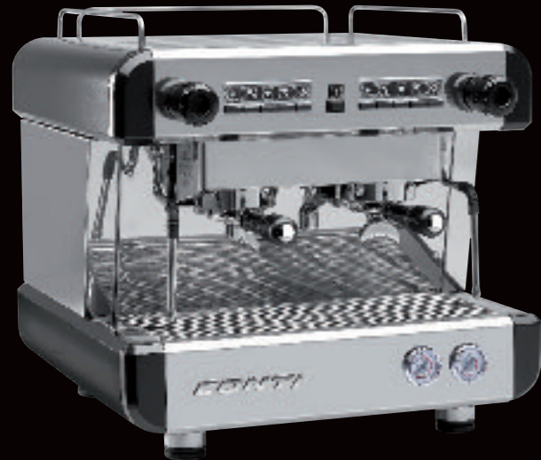
CC100 Compact Espresso