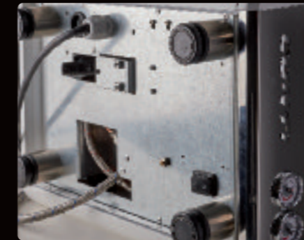
6 et 7