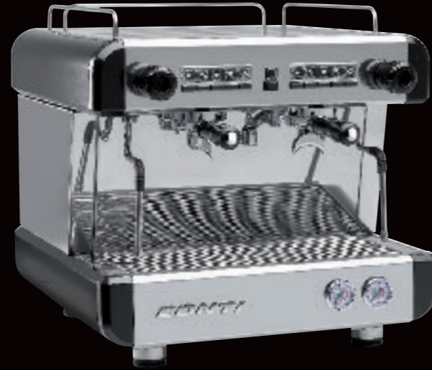
CC100 Compact Tall Cup