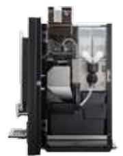
OB 3 (XL) NG