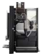
OB 2 (XL) NG