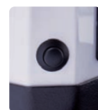
Regulation micrométrique de la mouture. Micro metrical grinding ajustement